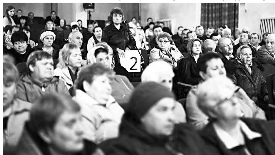
В Доме культуры на встрече с главой региона зал был переполнен