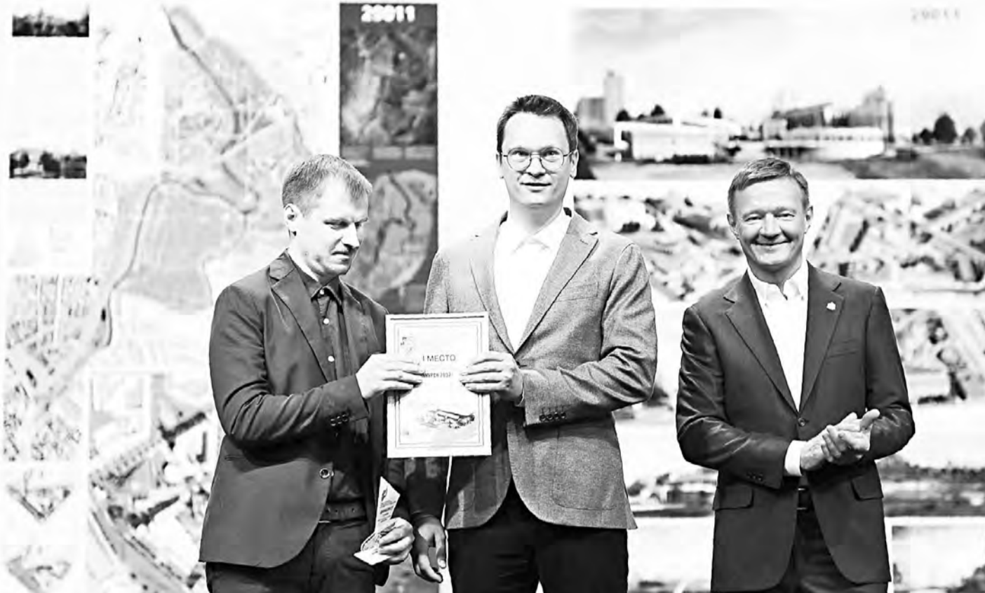
Победителей I этапа конкурса награждает лично глава региона